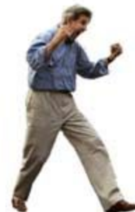
The new phone books are out!