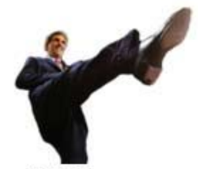
can-can French National Dance