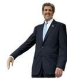
You may kiss my ring