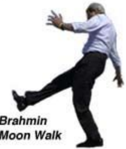
Brahmin Moon Walk