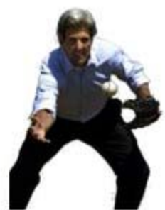
Bats right, throws right, catches right?