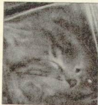
Un gattino prigioniero in bottiglia

«Produrre bonsai è una delle più nobili arti orientali», dicono con orgoglio i responsabili della Bonsaikitten, una ditta di New York. Al principio sembrava soltanto una montatura, qualche tempo fa la notizia venne addirittura smentita, ma il sito esiste realmente, per rintracciare l'azienda basta comporre un numero di telefono, lo 0012126627544. Nonostante centinaia di messaggi di protesta e raccolte di firme sulla rete, quelli della Bonsaikitten vanno avanti per la loro strada, anche perché, assicurano, «i gatti bon-